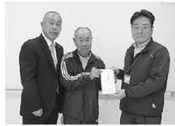
杵築ゴルフ倶楽部様