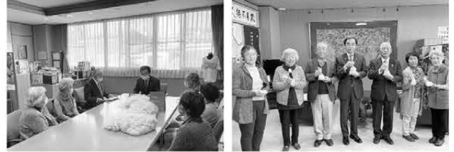
紅白もち1,000個を市長に届けました