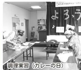
調理実習（カレーの日）

習字教室、川柳教室、絵手紙教室、折り紙教室 お茶友の会、立禅教室、ピンポン、大正琴の会 調理実習（カレーの日・独り者の会）、健康麻雀 ぎつみんな体操、パソコン教室など