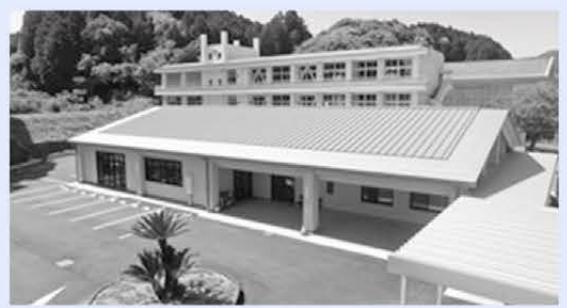
〈活動拠点施設〉山浦地区コミュニティセンター

山浦地区の人口 529人 高齢者率 52.7% 男性 239人 / 女性 290人 (令和2年5月末現在)