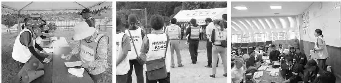
R 1.9.1 災害ボランティアセンター立上げ訓練の様相