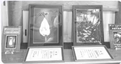
写真、数珠玉、折り紙作品 恒道ゆり会 (姫野貴美子さん、飯田ハツ子さん)