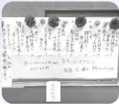
川柳 いきいきサロン奈多