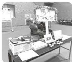
サロン使用品紹介 鴨川きつみんサロン