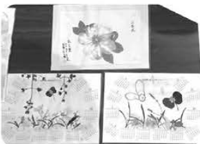
押し花アート 笑福てい