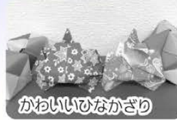
かわいいひなかざり