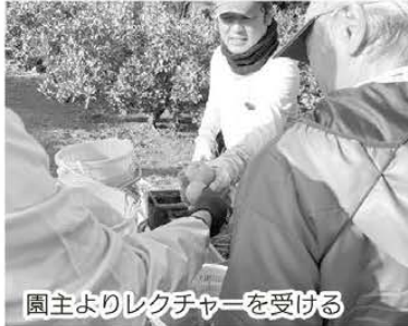
園主よりレクチャーを受ける