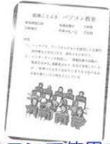
サロンで使用する チラシ作成