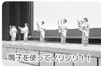
鳴子を使ってノリノリ!!