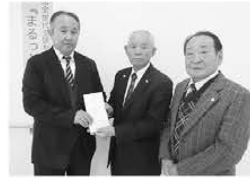
老人クラブ連合会 杵築支部様