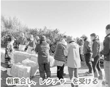
朝集合し、レクチャーを受ける