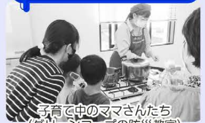
子育て中のママさんたち (グリーンコープの防災教室)