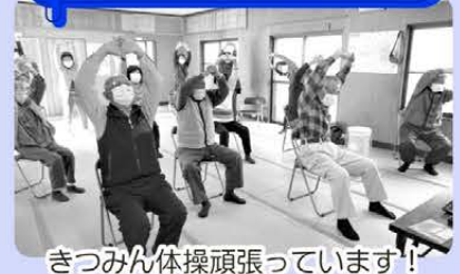
きつみん体操頑張っています!

現在、杵築市内には約100か所の高齢者や子育て中の親子が集まる寄り合いの場(サロン)があり、介護予防体操、調理、会食、趣味など様々な活動を通じて地域での交流を楽しんでいます。