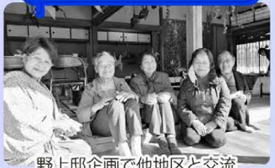
野上邸企画で他地区と交流