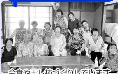
会食や干し柿づくりしています