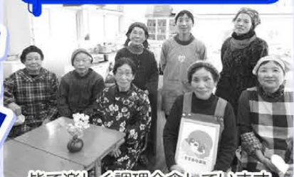
皆で楽しく調理会食しています