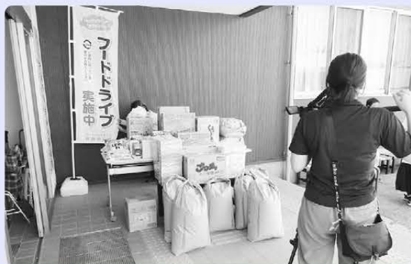
ケーブルテレビの取材