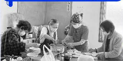
月に一度の会食を楽しみにしています