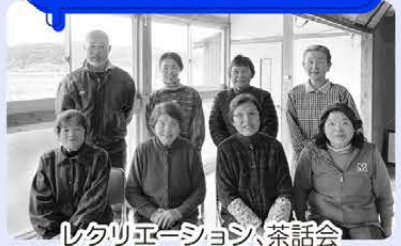
レクリエーション、茶話会