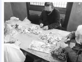
200個以上出来ました