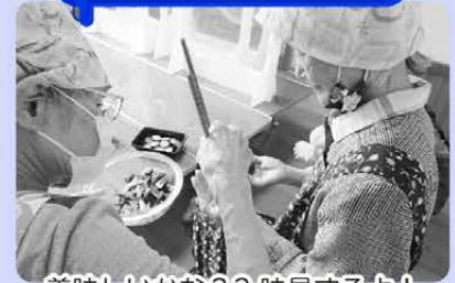
美味しいかな?? 味見するよ!