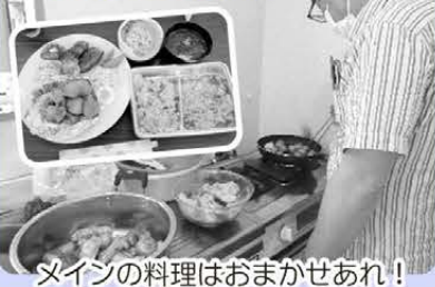
メインの料理はおまかせあれ!