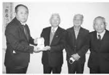
杵築市老人クラブ 連合会様