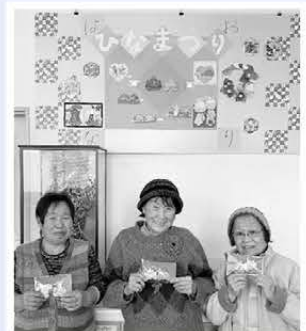
折り紙愛好会「はなおり」