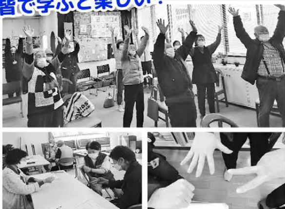
ぎょうざじゃんけんの様子 (にら・具・皮)