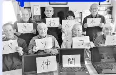
パソコンを学び、サロンで集まる日以外もオンラインサロンしています