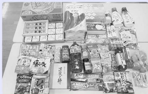
提供していただいた食料品等の一部