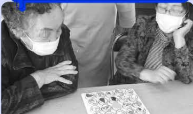
歌や体操、楽しいこと盛りだくさん!