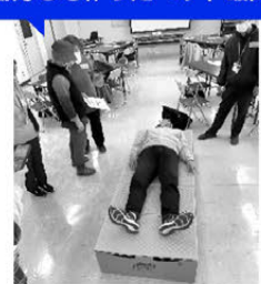
協力して作ったベッド最高♪

研修の終盤で、認知症当事者がともに作業をしていたことを参加者に伝えると、「まったく（認知症の人であることが）わからなかった」「逆に、わかりやすく作業内容を説明してもらえた」「認知症なんて関係なく、グループの中で苦手と得意をうまくマッチングできた」との声が聞かれました。